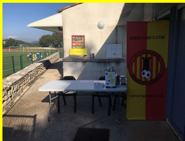
5 juin 2021 : Stand FCRB à la Fête des Sports