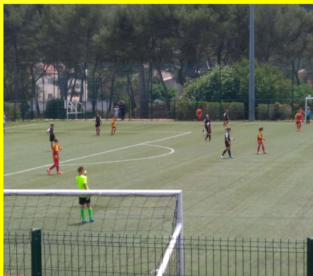
Mai 2021 : match amical U11