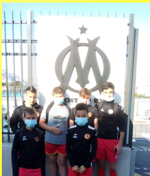
Mai 2021 : match amical U13 à l'OM Campus