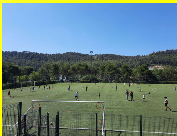
5 juin 2021 : Fête des Sports