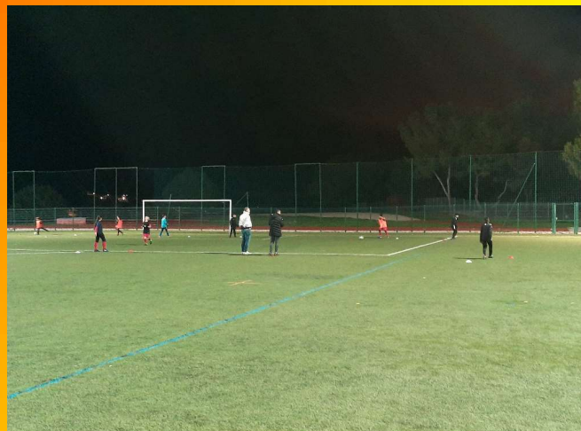
Novembre 2020 : Reprise des entraînements U11 – U13 post-confinement