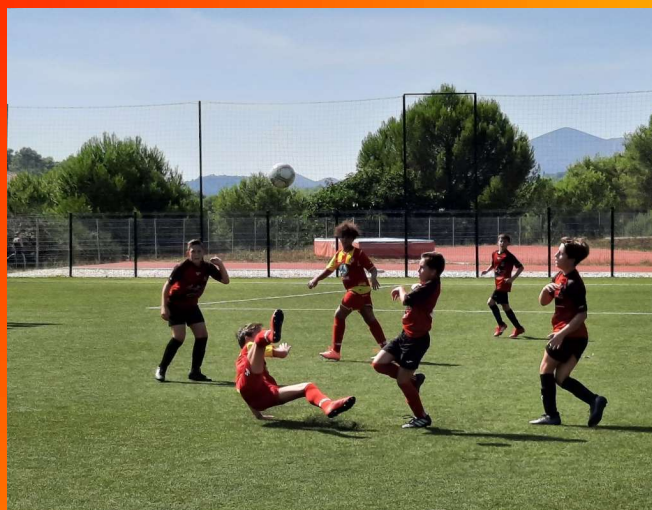
Septembre 2020 : Début des compétitions U11 – U13