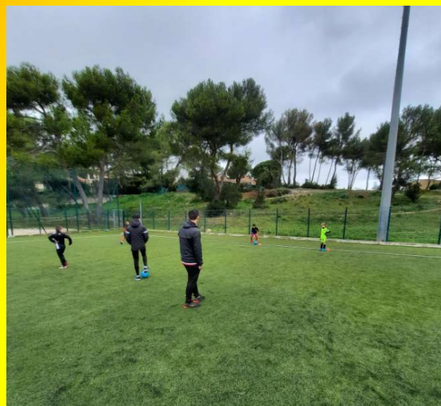
Décembre 2020 : Entraînements débutants exceptionnels du samedi après-midi